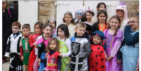
Tout sourire, les enfants étaient de la fête, ce samedi matin.