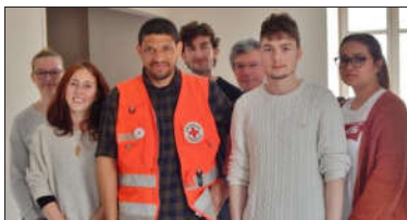
Une partie des personnes formées en PSC1 par la Croix Rouge samedi 9 mars au Petit Cep.

Samedi 9 mars, une journée de formation de Prévention et Secours Civiques de niveau 1 (PSC1) était proposée par la Croix Rouge au Petit Cep. Un formateur bénévole de l'unité locale centre-Ardèche, section de Saint-Péray, a encadré 10 personnes : de futurs professeurs des écoles, un jeune homme voulant faire un service civique, et un futur pompier volontaire pour lesquels le PSC1 est obligatoire, et d'autres participants pour des raisons professionnelles ou associatives, dont une jeune fille venue via le Pass Région. Le formateur a souligné que « depuis les attentats en France, il y a une recrudescence des demandes de formation PSC1, afin de pouvoir intervenir en cas d'urgence. Mais il y a encore peu de Français formés, deux sur dix en moyenne, contre huit sur dix par exemple en Allemagne, où le PSC1 entre dans l'obtention du permis de conduire ! » Un projet de loi est en cours pour que le diplôme de sauveteur soit reconnu par statut de collaborateur occasionnel de service public.