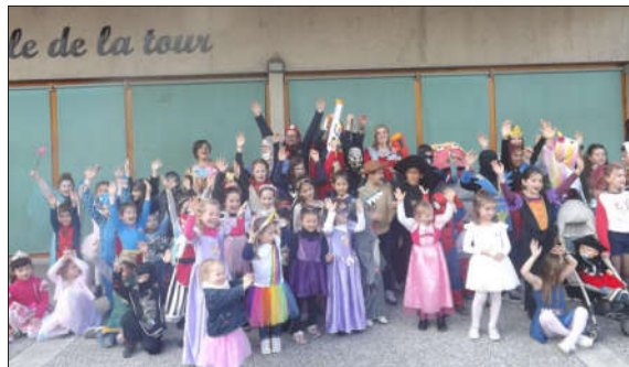
Avant le départ du défilé devant l'école de la Tour. Une bande qui fait peur. Les enfants ont rivalisé avec des déguisements très recherchés.