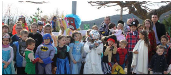
Les enfants ont posé devant Carmentran. Le thème des princesses, un grand classique souvent revisité.

L'association des parents d'élèves se chargeait de sustenter tous les participants venus en nombre cette année. Le tout dans une joyeuse ambiance festive.