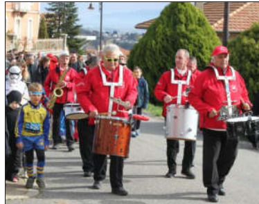
La Peña El Paso ouvrait la marche en musique.