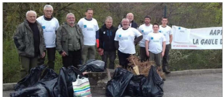
Cette action a été réalisée dans le cadre de l'opération nationale "Rivières propres".

Samedi dernier, la Gaule du Royans a procédé au nettoyage des berges de la rivière "La Lyonne". Deux chantiers ont été réalisés, en amont de l'ancienne station d'épuration de Saint-Jean-en-Royans et en aval du pont de Saint-Thomas-en-Royans. Il est toujours désolant de trouver autant de déchets, avec quelques surprises dont caddie, lames de scie à ruban, etc. Cette manifestation a été organisée dans le cadre de l'opération nationale "Rivières propres", en partenariat avec la Fédération départementale de pêche et protection des milieux aquatiques et le conseil départemental de la Drôme.